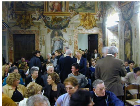
Il pubblico nella bellissima sala Zuccari durante l’intervallo

Poi, le note, in successione, di Skrjabin, Chopin, Fuga, Respighi e Gershwin ci tengono avvinti a Silvia, alle sue mani, alla gestualità del suo corpo, tutt’uno con la musica per tutta la durata del concerto. Tuttavia, su un brano in particolare vorrei esprimere la mia sincera ammirazione e cioè il notturmo postumo di Chopin, opera 72, il mio pezzo preferito!