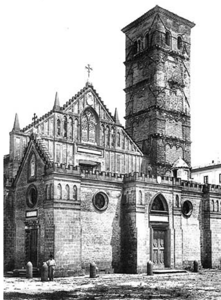
L'Abbazia nei primi del Novecento.